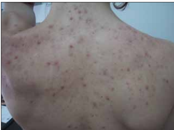
Figura 2. Acné grado II moderado.