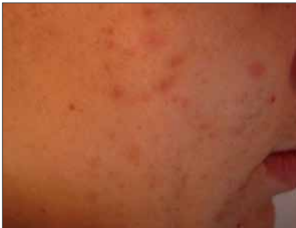
Figura 1. Acné grado I.